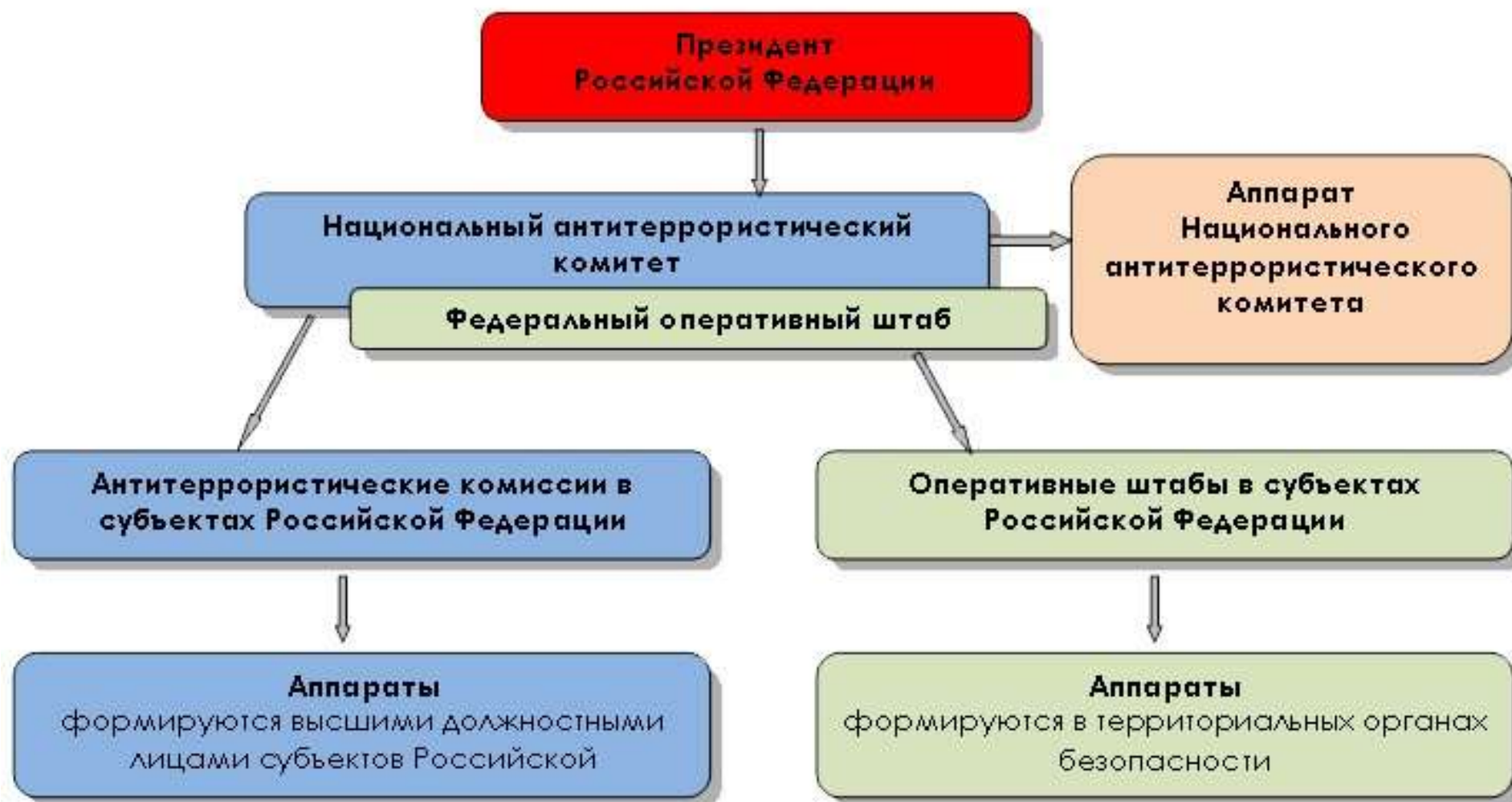
Схема координации деятельности по противодействию терроризму в Российской Федерации